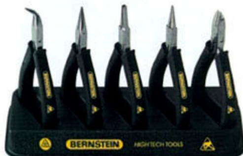
3-630 ESD fogókészlet 3db-os